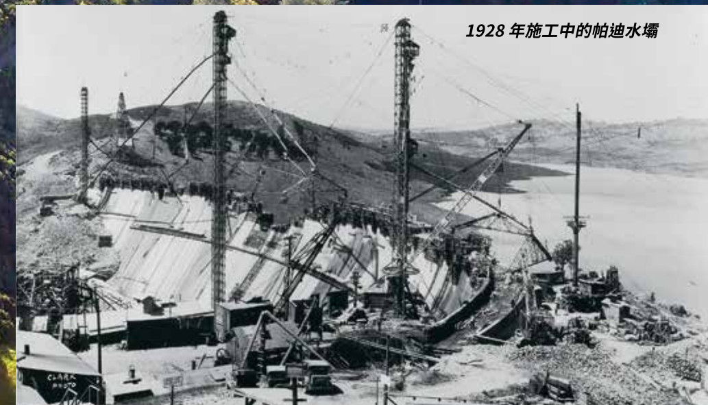
1928 年施工中的帕迪水壩