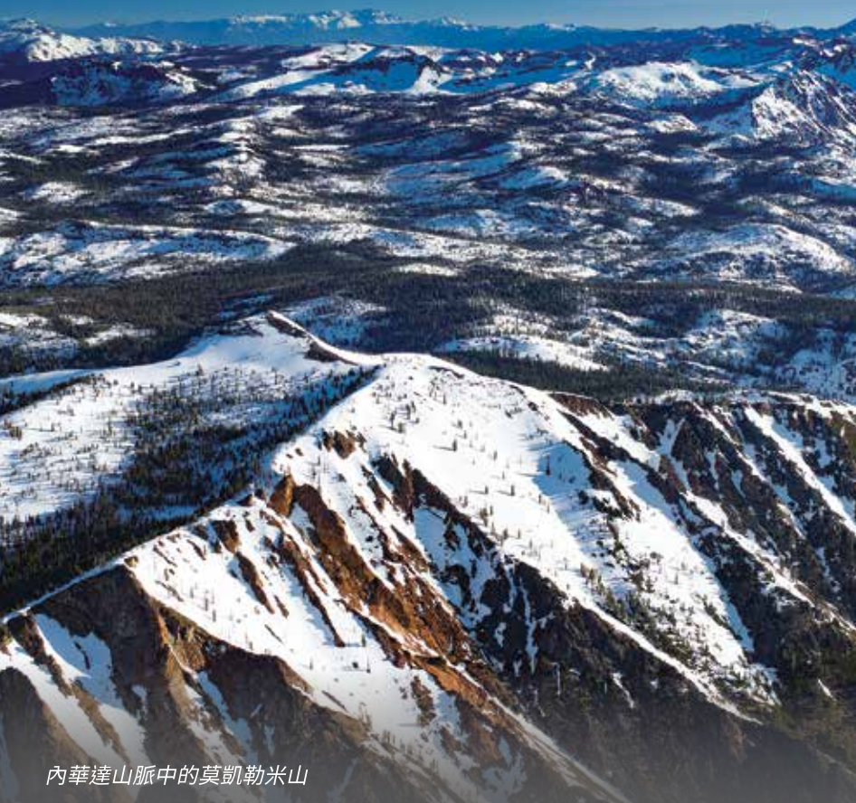
內華達山脈中的莫凱勒米山

375 Eleventh Street Oakland, CA 94607 1-866-403-2683 www.ebmud.com