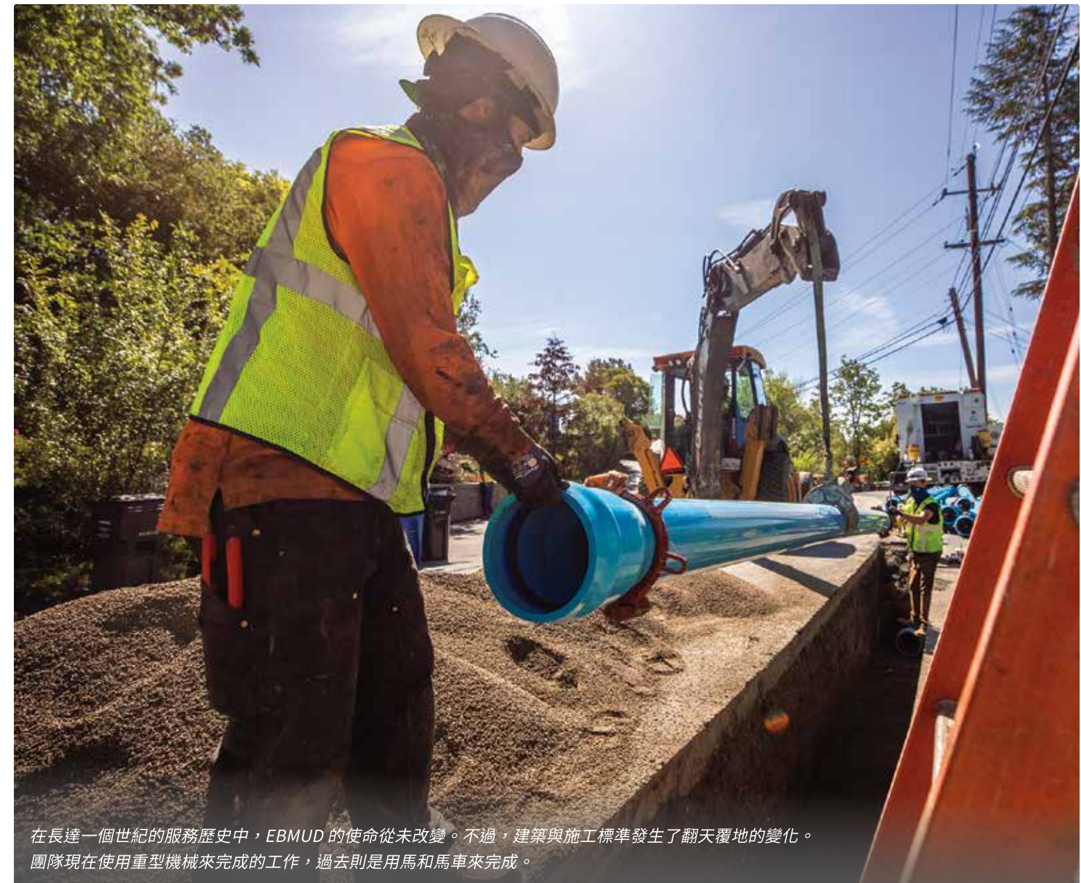
在長達一個世紀的服務歷史中，EBMUD 的使命從未改變。不過，建築與施工標準發生了翻天覆地的變化。團隊現在使用重型機械來完成的工作，過去則是用馬和馬車來完成。