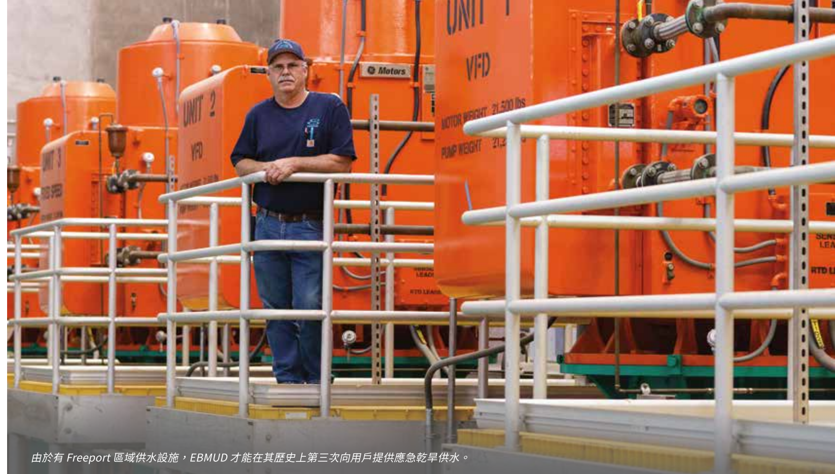
由於有 Freeport 區域供水設施，EBMUD 才能在其歷史上第三次向用戶提供應急乾旱供水。

H Walnut Creek、Lafayette 和 Orinda 淨水處理廠不必監測 TOC。已處理水中的 TOC 數值與源水中的 TOC 數值相近。